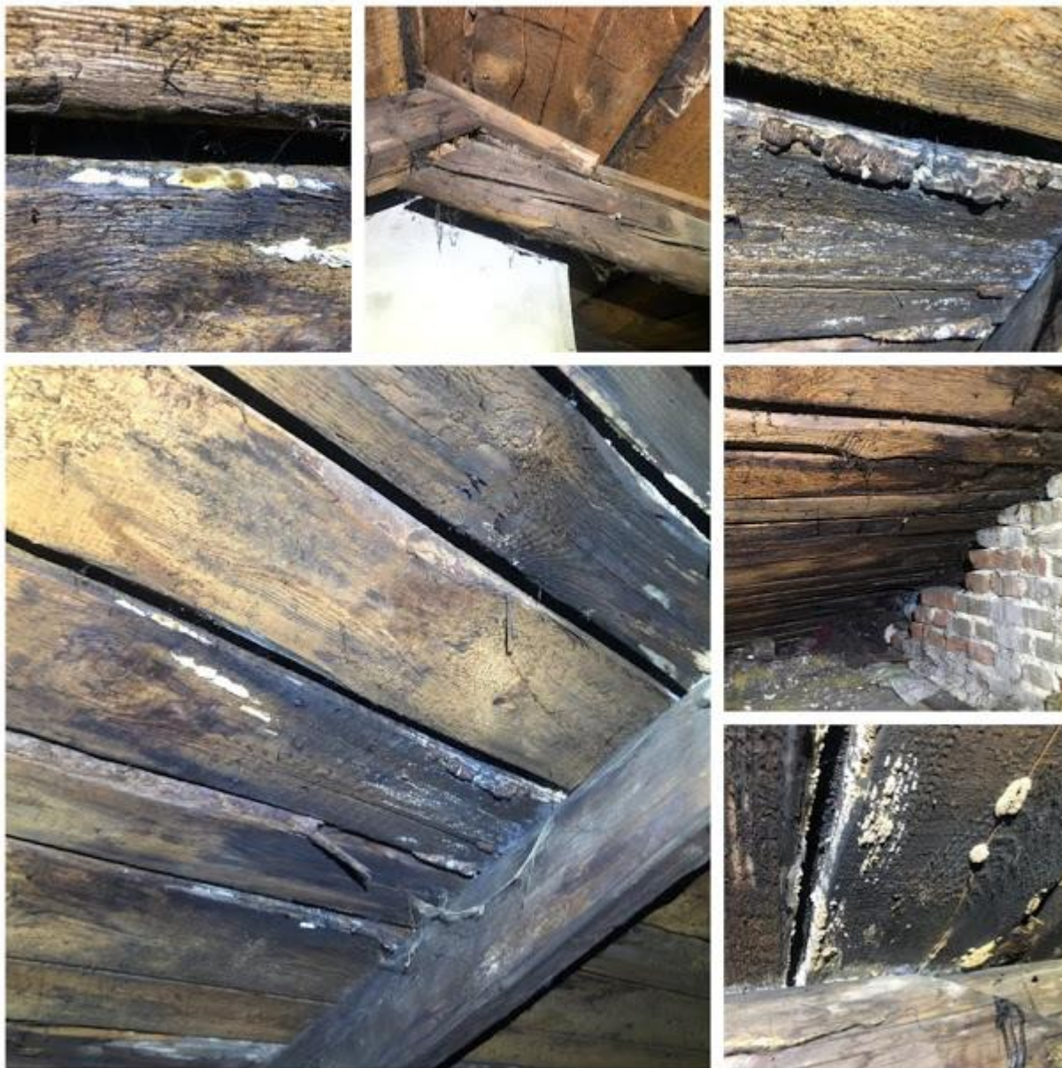
Fot. 27-32. Więźba dachowa i deskowanie – Spękania na połączeniu krokwi, widoczne zasuszone fragmenty grzybnia grzyba domowego ( Serpula lacrymans ).