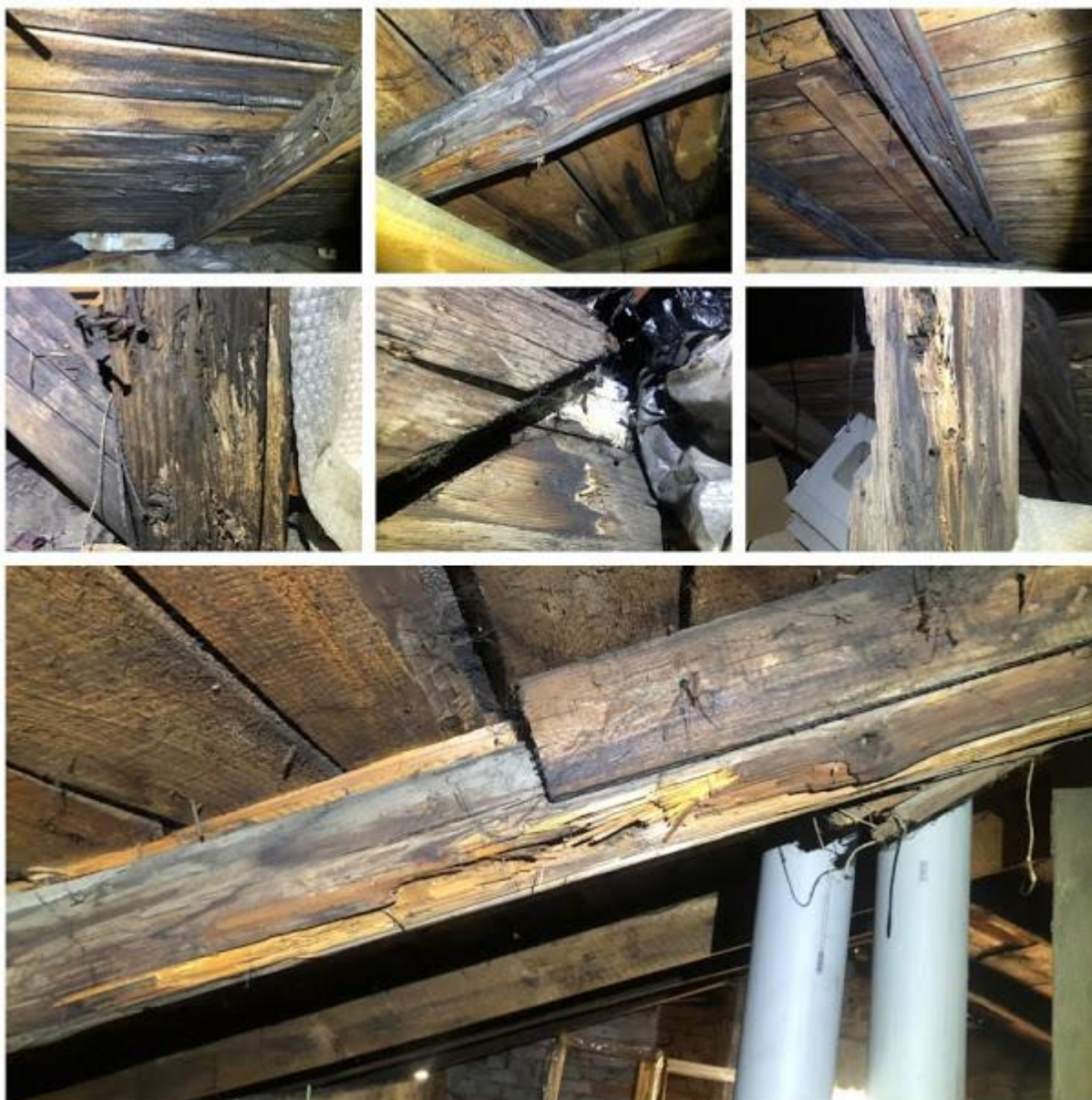
Fot. 20-26. Więźba dachowa i deskowanie – licznie występujące otwory wylotowe i żerowiska spuszczela pospolitego ( Hylotrupes bajulus ) i kołatka domowego ( Anobium punctatum ), widoczne zasuszone fragmenty grzybni grzyba domowego ( Serpula lacrymans ), rozkład brunatny drewna.