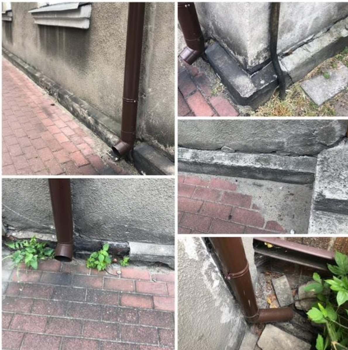
Fot. 15-19. Budynek wyposażony w nowe rynny, widoczne odspojenia i uszkodzenia cokołu w strefie przyziemia.