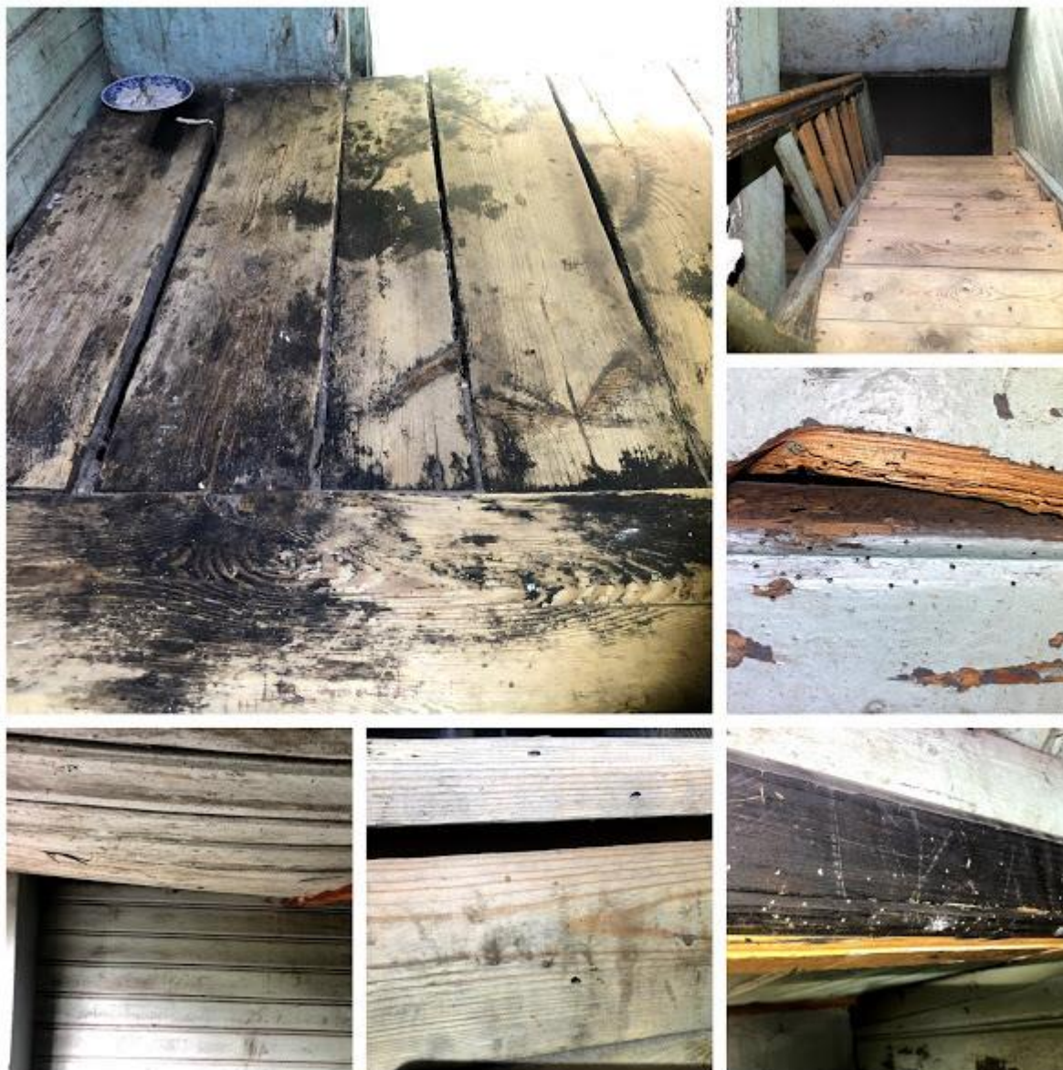
Fot. 47-52. Klatka schodowa – uszkodzone pochwyty, ubytki w przęśle, ruchomy podest, uszkodzone stopnice, żerowiska kołatka domowego ( Anobium punctatum ) i spuszczela pospolitego ( Hylotrupes bajulus ) z licznymi otworami wylotowymi.