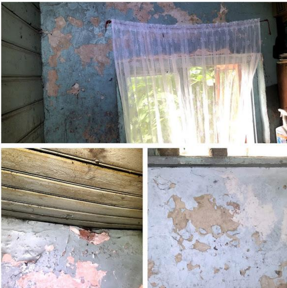
Fot. 58-60. Klatka schodowa – spekania tynków i odspojenia powłok malarskich na ścianach murowanych, powyginane deski sufitowe, żerowiska kołatka domowego ( Anobium punctatum ).