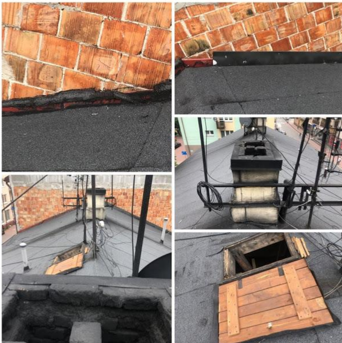
Fot. 1-5. Pokrycie dachu papą nie wykazuje uszkodzeń. Brak obróbek blacharskich na połączeniu dachu z sąsiednim budynkiem.