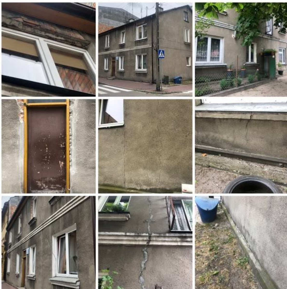
Fot. 6-14. Widoczny ogólny zły stan elewacji: odspojenia tynków i cegieł, spekania murów, odspojenie cokołu w strefie przyziemia.