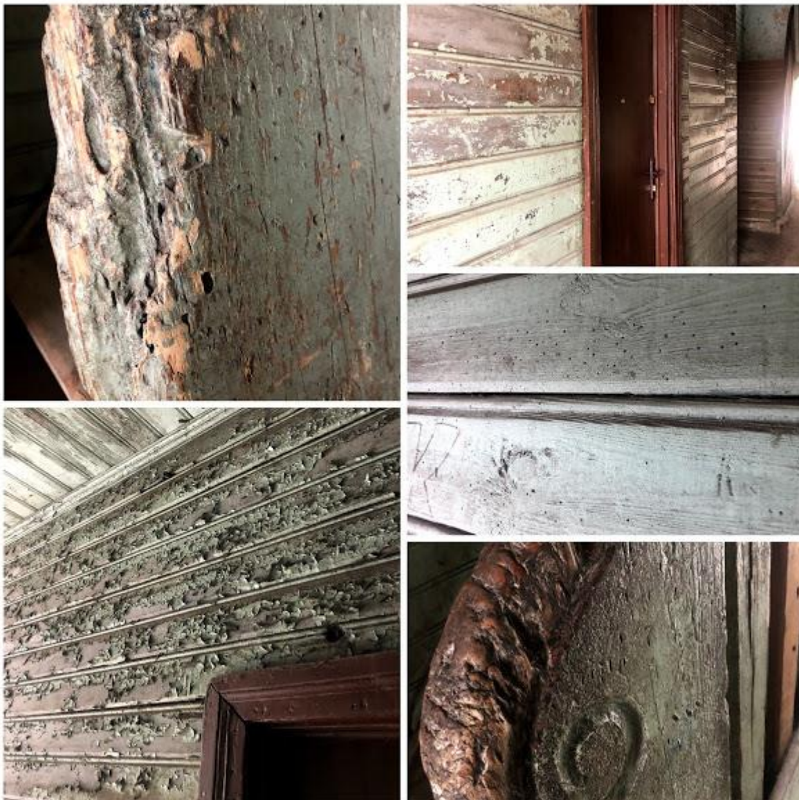
Fot. 53-57. Klatka schodowa – uszkodzone pochwyty, żerowiska kołatka domowego ( Anobium punctatum ) i spuszczela pospolitego ( Hylotrupes bajulus ) z licznymi otworami wylotowymi, złuszczenia powłok malarskich.